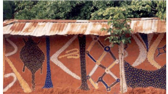
Mural na kući naroda Igbo, Nigerija. Mural na kući naroda Basoto, Južna Afrika.