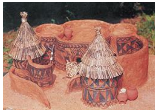
Model kuće naroda Gurunsi; pečena glina.

Izložba „Tradicionalni murali Afrike“ obuhvata 72 fotografije koje prikazuju afričke kuće zidova oslikanih muralima iz različitih zemalja afričkog kontinenta (Lesoto, Južnoafrička republika, Burkina Faso, Gana, Nigerija, Togo, Čad) i selekciju najznačajnijih likovnih detalja i motiva na muralima.