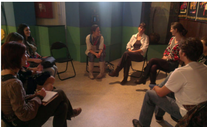
Слика 3. Консултације са кустоскињама Музеја

афричке уметности где се врши одабир кандидата на основу њиховог мотивационог писма и биографије. Број примљених кандидата је ограничен на десет како би сви чланови групе добили адекватну пажњу ментора. Студентска организација објављује ранг-листу и организује први долазак у Музеј афричке уметности, чиме се завршава важан део њиховог учешћа у програму. Даљу координацију програма и менторство преузимају кустоскиње, ауторке програма.