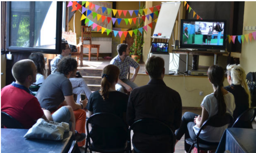
Слика 8. Час јавног наступа – анализа снимака

Такође, студенти су у евалуацији тражили већи број вођења, тако да је у том сегменту проширено деловање њиховим укључивањем у вођење школских група, што је захтевало да се додатно обуче за рад са децом и младима у завршном циклусу програма. Ова промена је захтевала да се, после четири године, продужи време трајања пројекта са пет (март – октобар) на десет месеци (март – децембар).