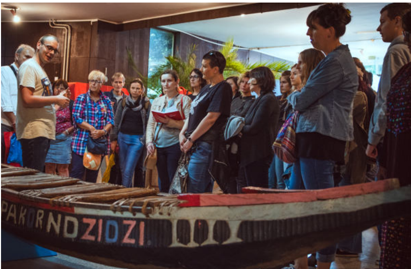
Слика 10. Тематско вођење на Афро фестивалу испред чамца на коме пише „Nyimkor Ndzidzi“, што у пренесеном смислу значи „Човек не може опстати сам“

Студенти који су били полазници програма „Практикум“ у анонимном евалуационом формулару (документација Музеја афричке уметности) отвореног типа нагласили су да им је највише значила прилика да буду вођени од стране ментора, затим да усаврше вештине јавног наступа, као и да сами креирају текст и осмисле вођење. Подршка кустоскиња и едукатора за јавни наступ, у свакој фази развоја, доступност, пријатељски однос и отвореност, нешто је што студенти наводе као значајне ставке у раду. Могућност да сталну поставку лично интерпретирају, да је самостално истраже и прилагоде својим интересовањима,