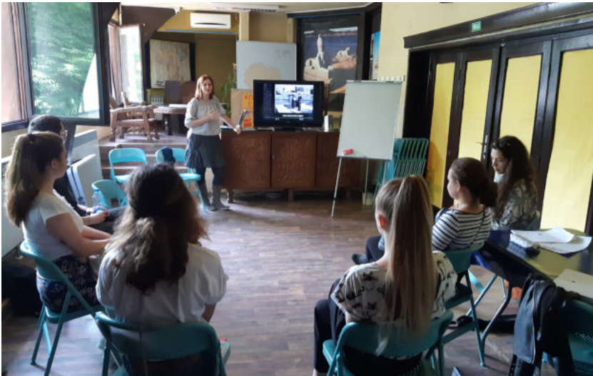
Слика 4. Предавање о програмском историјату Музеја афричке уметности

Пре него што изађе пред публику, сваки учесник има прилику да испроба вођење и тако искуси како функционишу замишљена путања и припремљен текст у односу са публиком коју, у пробама, чине остали учесници програма.