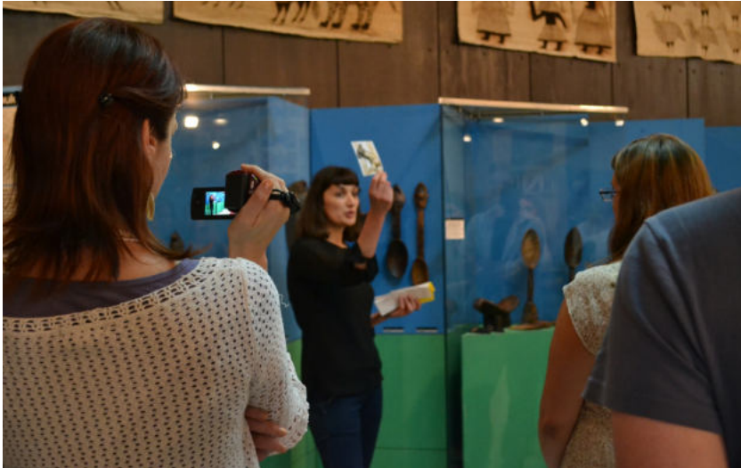
Слика 6. Снимање јавног вођења

Следећи циклус јавних вођења одвија се током тродневне манифестације „Афро фестивал“ у јуну месецу, где студенти понављају тематска вођења и примењују савете ментора. Такође, вођењем кроз сталну поставку Музеја током