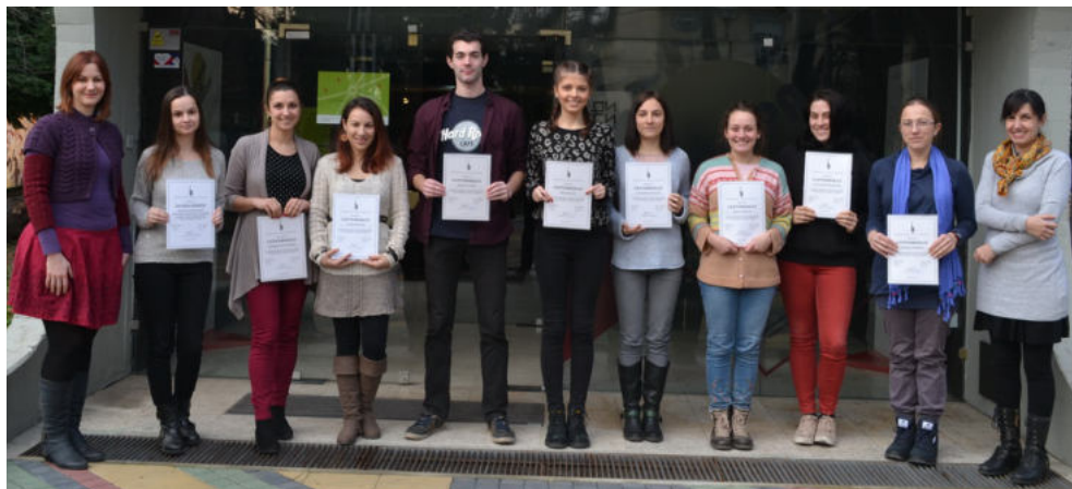
Слика 7. Студенти са потврдама о учешћу у програму, генерација 2017.

У самој завршници програма „Практикум“ менторке организују радионицу евалуације помоћу које ментори и учесници сабирају утиске и добијају повратне информације. Након радионице студенти добијају потврду о учешћу у програму.