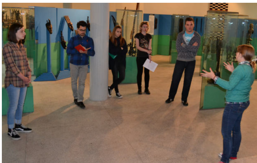
Слика 5. Проба вођења

који су били у истој позицији пре само годину дана, даје добре резултате у обрађивању актуелних учесника програма. У завршници обуке студенти пишу кратке најаве сопственог вођења које ће се наћи у штампаној брошури. Студенти организују дистрибуцију промотивног материјала (брошура и плаката) на факултетима и у другим омладинским центрима. Кроз ову фазу студенти уче да промовишу програм који су креирали, односно да допру до публике за свој наступ. Каријерни центар у завршној фази обуке учествује у промоцији и даје подршку студентима у ширењу вести о недељи „Практикума“ на Филозофском факултету.