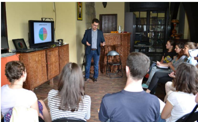
Слика 2. Први час јавног наступа

потенцијале, али и сензибилитет за реакцију публике на садржај и начин презентације. Посебна обавеза и задатак кустоскиња-менторки је да их упуте или само подсети на постојање стереотипних и поједностављених тумачења која се могу појавити како код публике, тако и код сарадника током вођења кроз изложбе.