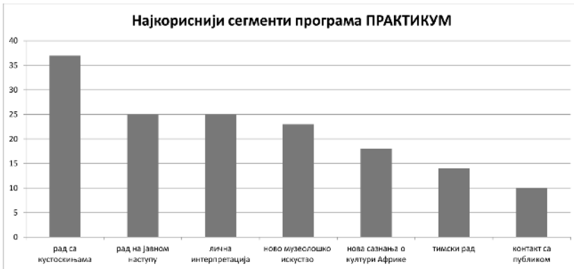
Слика 9. Графикон – евалуација програма (аутор: И. Војт)

Музеји имају обавезу да буду важан полигон за развијање одговорних чланова друштва. То су простори усавршавања, активног учешћа, сазнавања, грађења самопоуздања и интеракције са предметом. Рад на граници учења и забаве развија чула, одгаја лични израз и изграђује стваралачке личности, способне за логичко и самостално закључивање. Тако се стварају здрави, самосвесни, критички оријентисани грађани, активни учесници друштва (Subotić 2005: 23). Музејска едукација би требало да буде изнад пуког процеса преношења знања и да препозна да је њен задатак да побољша друштво (Hein 2012: 11).